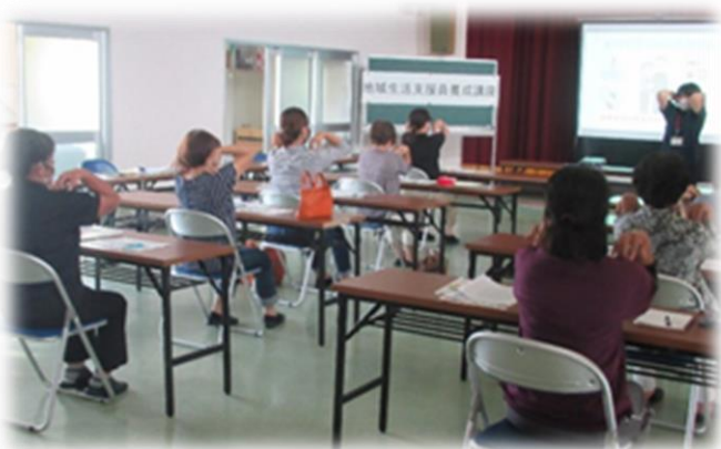
講義の前に、簡単ストレッチでリフレッシュ(*^-^*)

令和2年10月15日（木）社協ホールにて、第2回生活支援有償ボランティア支援員養成講座を開催し、9名の方が受講いたしました。講座では、生活支援サービスの目的、高齢者や認知症の方とのコミュニケーション、高齢者の体や知っておきたい症状・対処法などを学び、参加者には修了証書が交付されました。終了後、参加者からは「以前からこの活動に興味があった」「少しぐらいはお手伝いできそう」「何か私にできる事があればぜひやってみたい」との感想を頂きました。