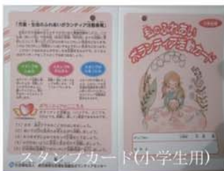
スタンプカード(小学生用)